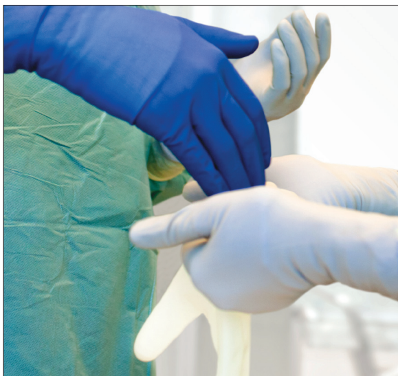
Dobbelthandsker med punkturindikation

– Mölnlycke Health Care) og iført dobbelthandsker (Biogel-dobelthandske med punkturindikationssystem – Mölnlycke Health Care). Dobbelthandskesystemet bestod af en farvet inderhandske kombineret med en kraftig standard yderhandske.