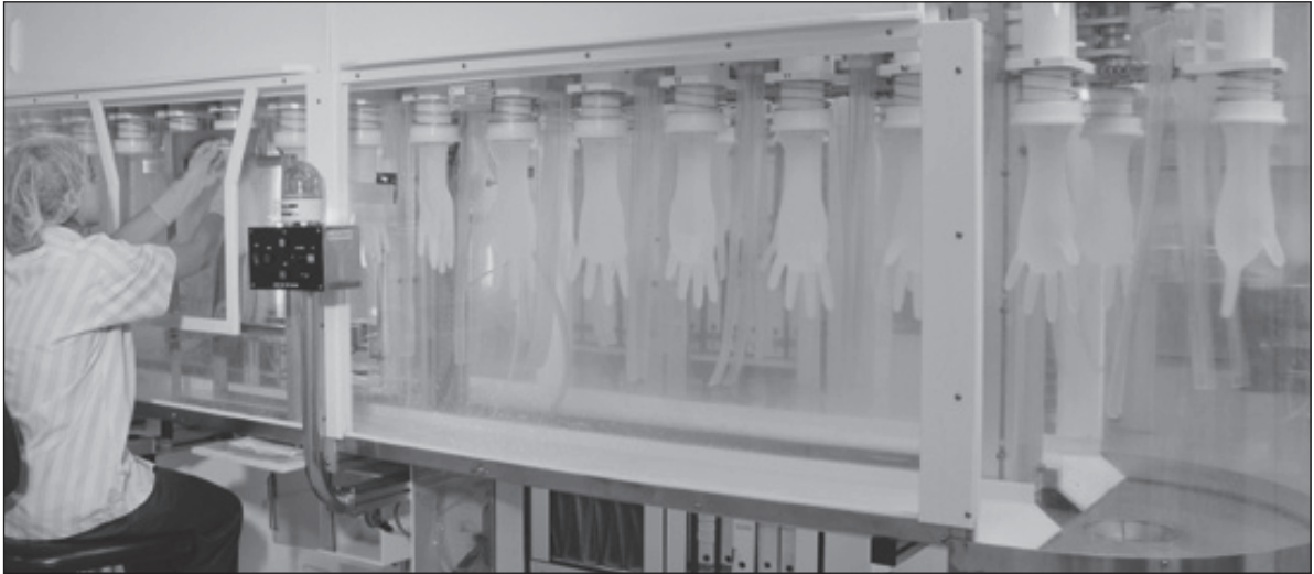
Vandtest i henhold til standarden EN 455 del 1