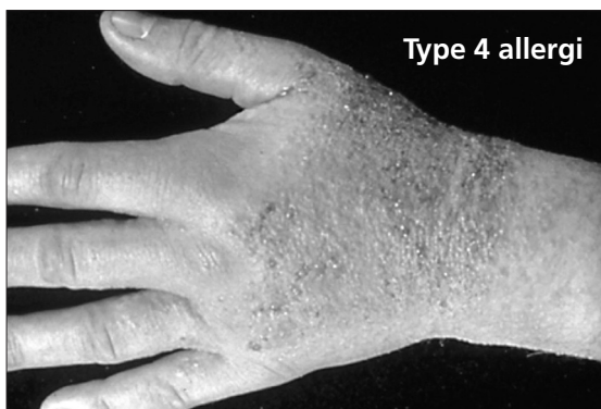
Type 4 allergi