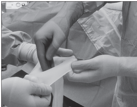
Handske udskiftning efter perforation af yderhandsken