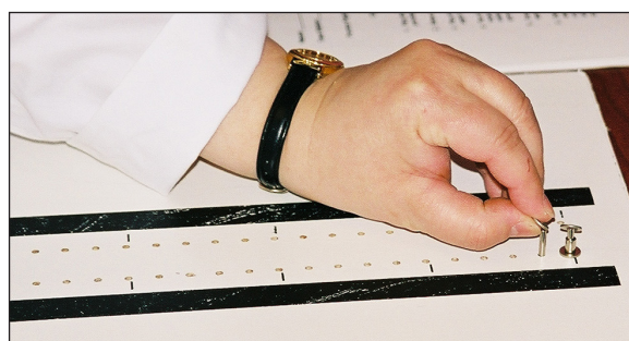
Purdue Peg-board test.

Data om fingerspidfølsomhed og fingrenes bevægelighed blev indsamlet for hver enkelt deltager i rækkefølgen ubehandset, iført et enkelt par handsker (Biogel