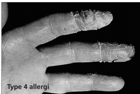
Type 4 allergi

Products and Medical Devices begynder flere og flere regionale sygehusenheder alligevel at bruge handsker af syntetisk nitril, polyisopren og polychloropren i stedet for NGL-handsker. Det rejser en række spørgsmål: