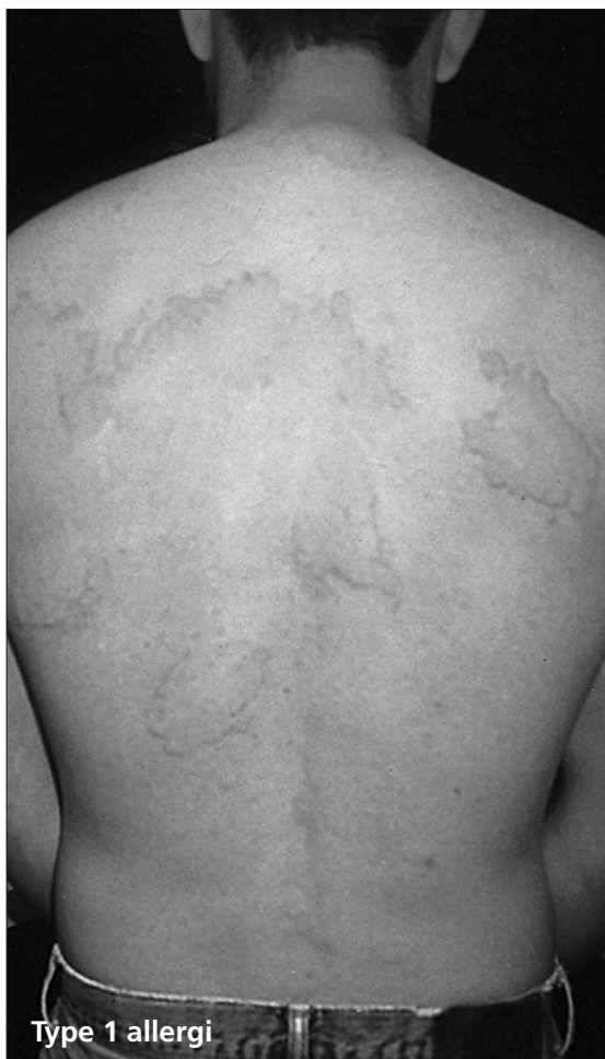
Type 1 allergi